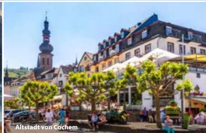
Altstadt von Cochem