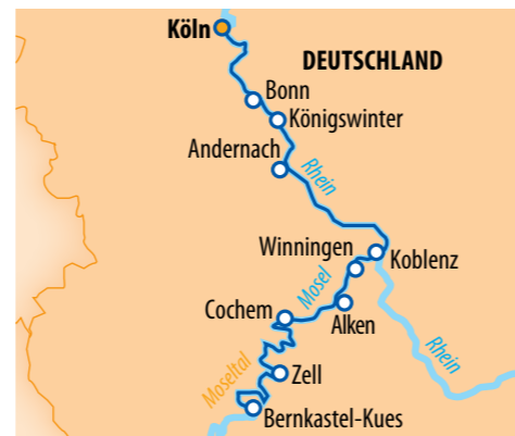
Reiseverlauf 21.10.–27.10.2025 7 Tage/6 Nächte Rhein & Mosel (Code: DUGMSL)