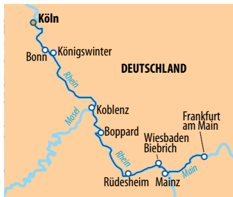
Reiseverlauf 15.10.–21.10.2025 7 Tage/6 Nächte Rhein & Main (Code: DUGMAI)

Genießen Sie die harmonische Verbindung aus Entspannung für Mensch und Tier, während wir gemeinsam auf dieser unvergesslichen Reise neue Orte entdecken. An Bord von MS VistaGrace gleiten wir auf dem Rhein entlang in unser Nachbarland, die Niederlande. Bei Landgängen in Städten wie Rotterdam, Nijmegen und Düsseldorf können wir und unsere vierbeinigen Begleiter uns die Beine vertreten, bevor unser Schiff zum nächsten Hafen aufbricht. Zwischendurch genießen wir an Bord den zuvorkommenden Service der Crew und die ALL INCLUSIVE-Verpflegung, während die Uferlandschaften an uns vorbeiziehen. Ein besonderes Erlebnis für Mensch und Hund.